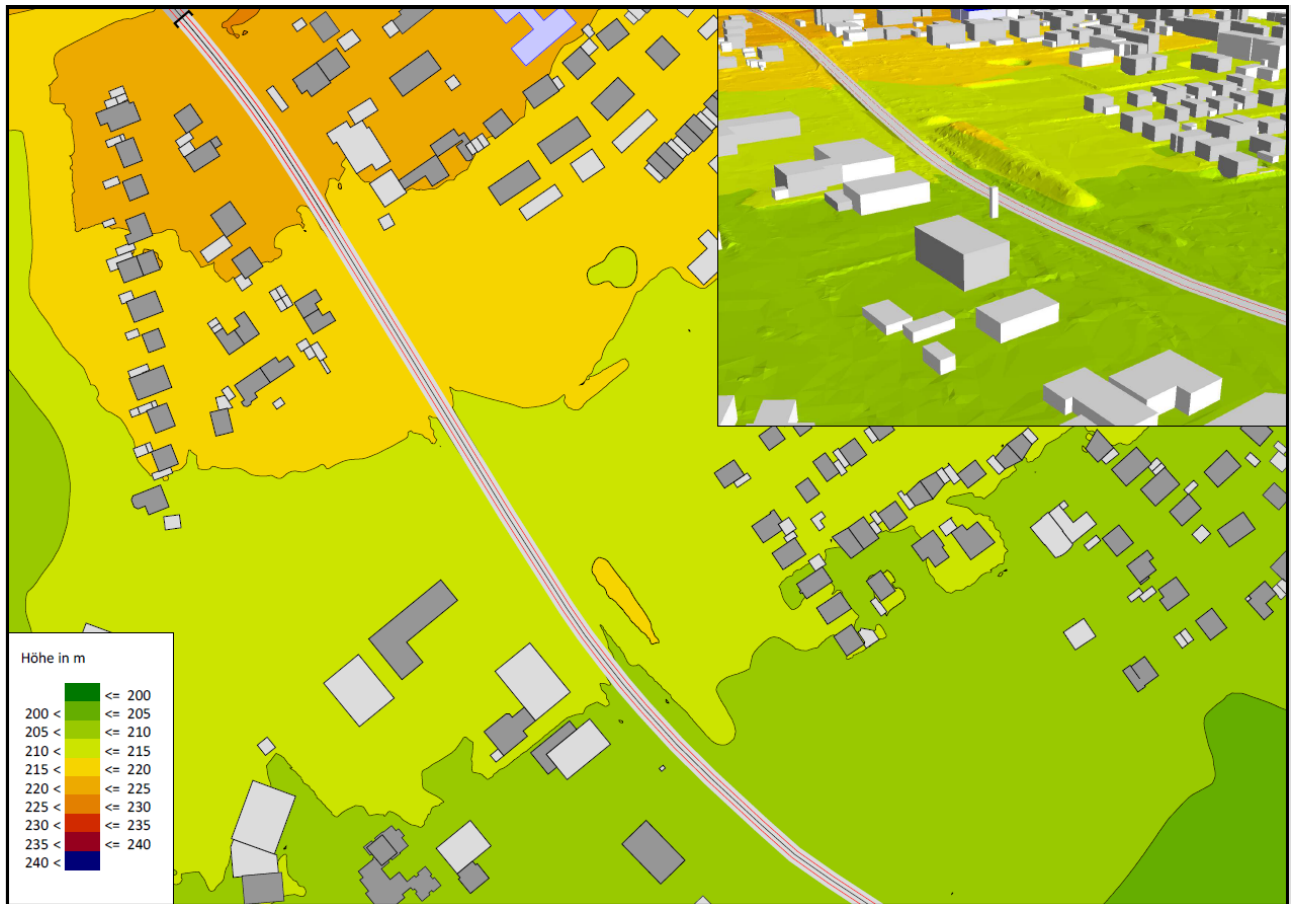
Abbildung 3 Digitales Geländemodell, Berücksichtigung von Lärmschutzwällen

Maßnahmen aus der Lärmaktionsplanung wie Geschwindigkeitsreduktionen werden im Modell berücksichtigt.