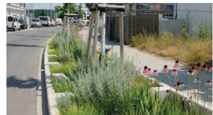
Tiefbeet mit Bäumen (BGS, 2023)