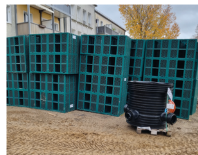
Rigolen vor Einbau in Berlin Biesdorf (BGS 2023)