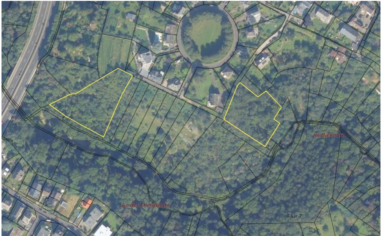
Abbildung 1: Flächen für die Entwicklung von neuen Mauereidechsen-Lebensräumen (Darstellung Sweco, Dezember 2023)